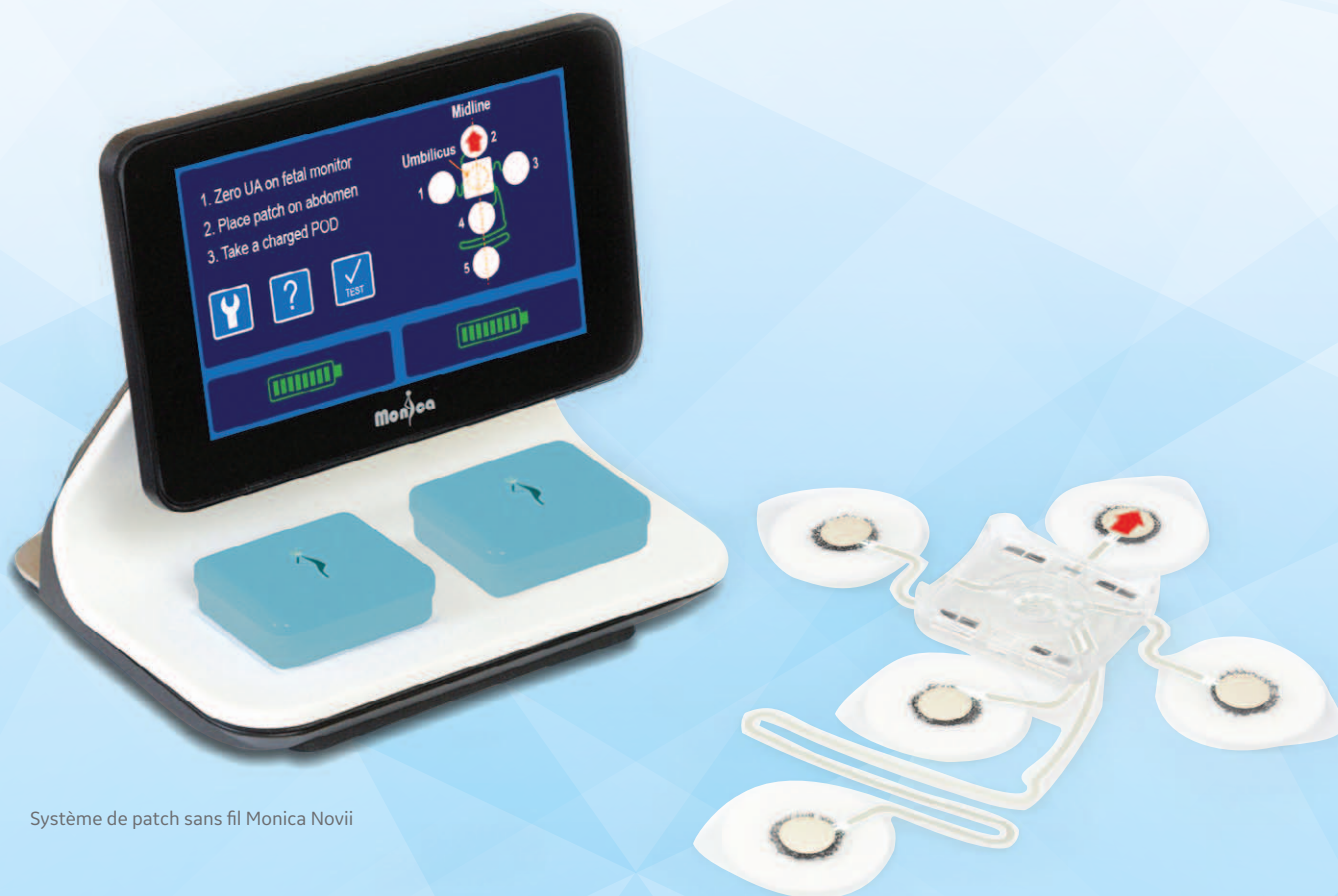
Système de patch sans fil Monica Novii